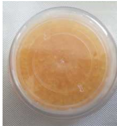
Pastille orange neuve

Lorsque vous ne les portez pas, le gobelet de séchage avec les capsules déshydratantes, permettent d'ôter l'humidité contenue dans vos appareils. Ils réduisent ainsi les risques d'oxydation des piles ou des composants électroniques.